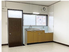
■ダイニングキッチン